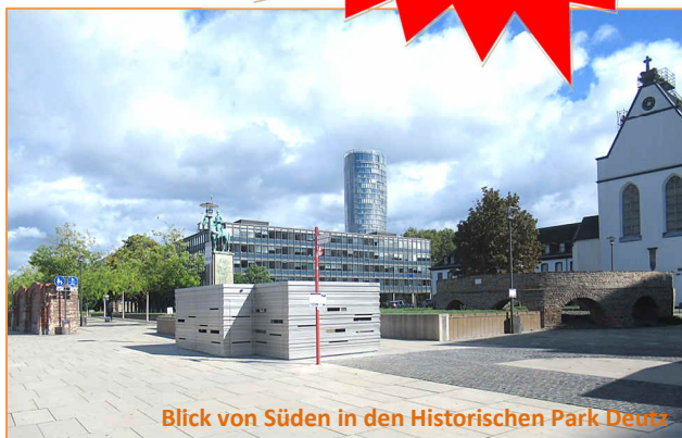
Blick von Süden in den Historischen Park Deutz

Seit dem 27. Juli 2021 ist der Niedergermanische Limes UNESCO-Welterbe . Dadurch wurde das spätrömische Brückenkopfkastell „Divitia“ im Historischen Park Deutz eine von drei neuen UNESCO-Welterbestätten in Köln. Mit seiner Besonderheit im Rechtsrheinischen zu liegen, also nicht im Gebiet des ehemaligen römischen Imperiums, sondern im germanischen „Feindesland“, hat das Deutzer Kastell am heutigen Rheinboulevard ein Alleinstellungsmerkmal am rund 400 Kilometer langen Niedergermanischen Limes.