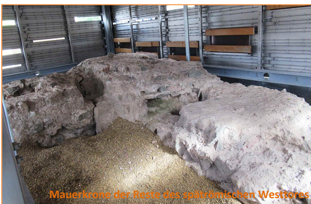
Mauerkrone der Reste des spätrömischen Westtores

Diese historische Mitte im heutigen Historischen Park Deutz wollen wir Ihnen mit unserer Führung ein wenig näherbringen und laden Sie daher ganz herzlich zu einem Rundgang ein, zu einem Rundgang mit vielen Stationen der langen und spannenden Deutzer Geschichte aller Epochen.