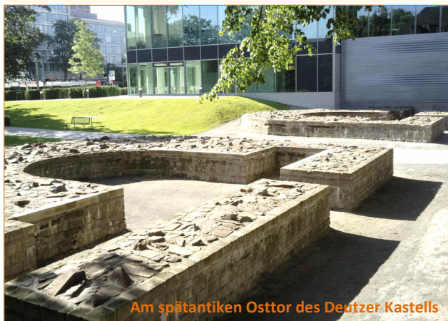
Am spätantiken Osttor des Deutzer Kastells

So führen wir Sie über den archäologischen Bereich des Rheinboulevards mit dem Bronzemodell des Deutzer Kastells, vorbei an römischen, mittelalterlichen und preußischen Mauern, durch die ehemalige Abteikirche Alt St. Heribert mit ihrer mittelalterlichen Krypta und der ersten Grabstätte des Heiligen Heribert, weiter entlang des historischen Verlaufs der Via praetoria, von der Porta dekumana bis zur Porta praetoria, dem römischen Osttor des Kastells.