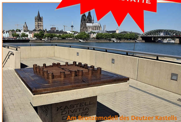
Am Bronzemodell des Deutzer Kastells

Ihre Anmeldung richten Sie bitte schriftlich, wegen der begrenzten Teilnehmerzahl von 25 Personen, oder wegen möglicher Rückfragen an: info@fhpd.de