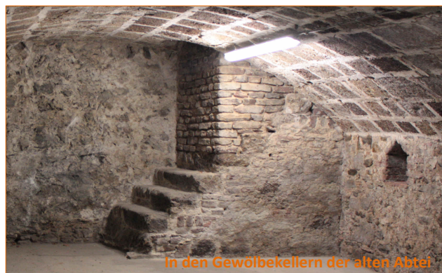
In den Gewölbekellern der alten Abtei